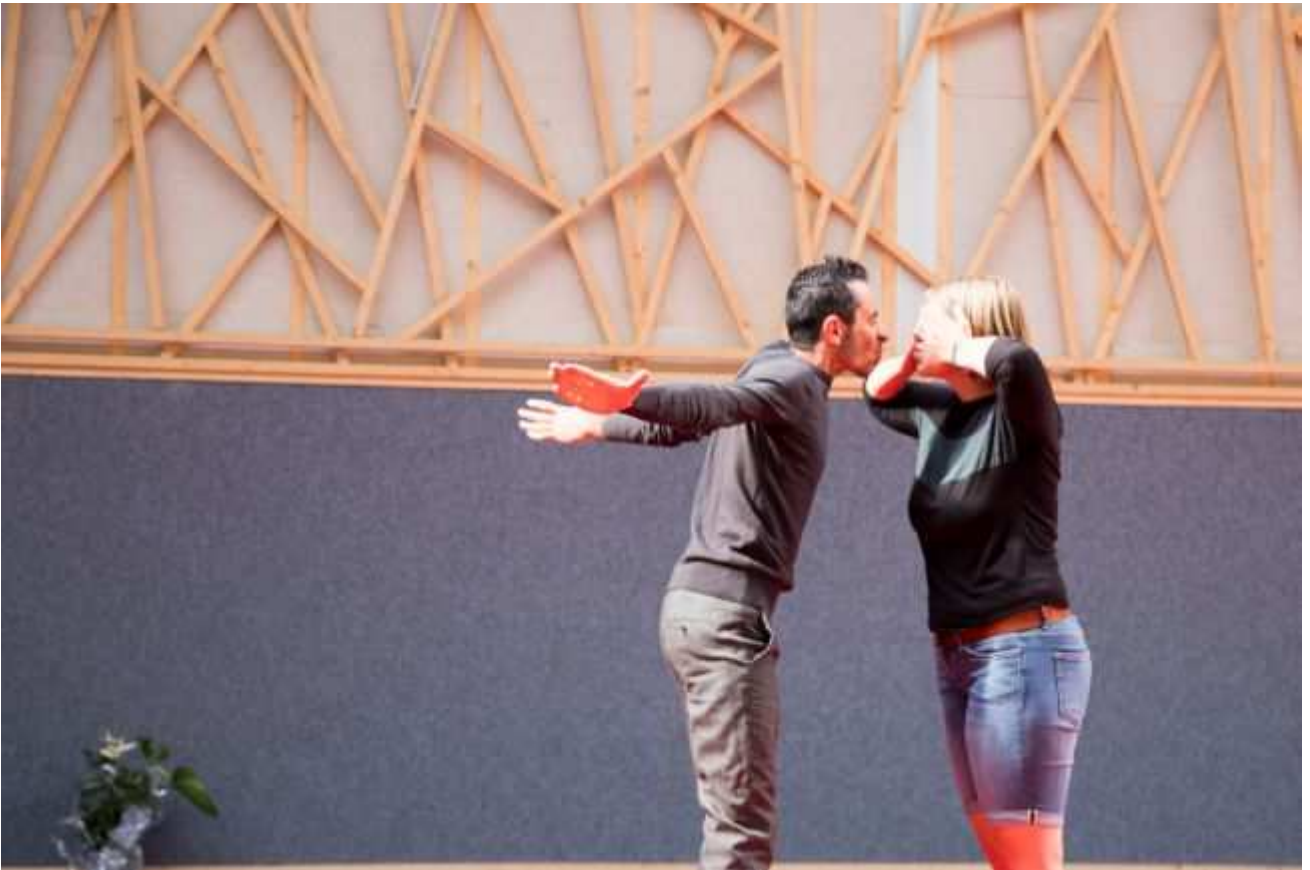
(Zwei vom boat people projekt haben eine Szene gespielt)